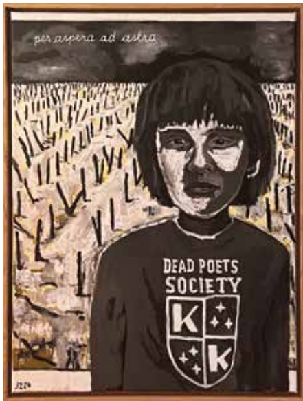
Selbstbildnis als Gymnasiast [vor einem Bild von Anselm Kiefer] - Acryl und Öl auf Leinwand, JZ 2024