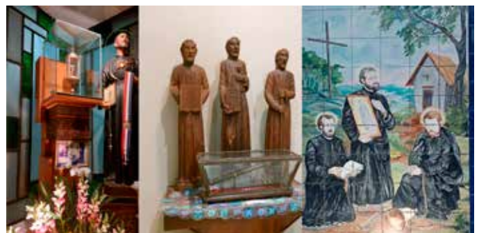
Darstellungen des Landesheiligen Roque González de Santa Cruz samt der Waffe (Bild mitte), durch die der Märtyrer den Tod fand