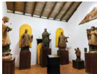
Die ehemaligen Reduktionen Santa Maria de Fe und San Ignacio de Guasú (Bild) wurden zu von Jesuiten geführten Museen