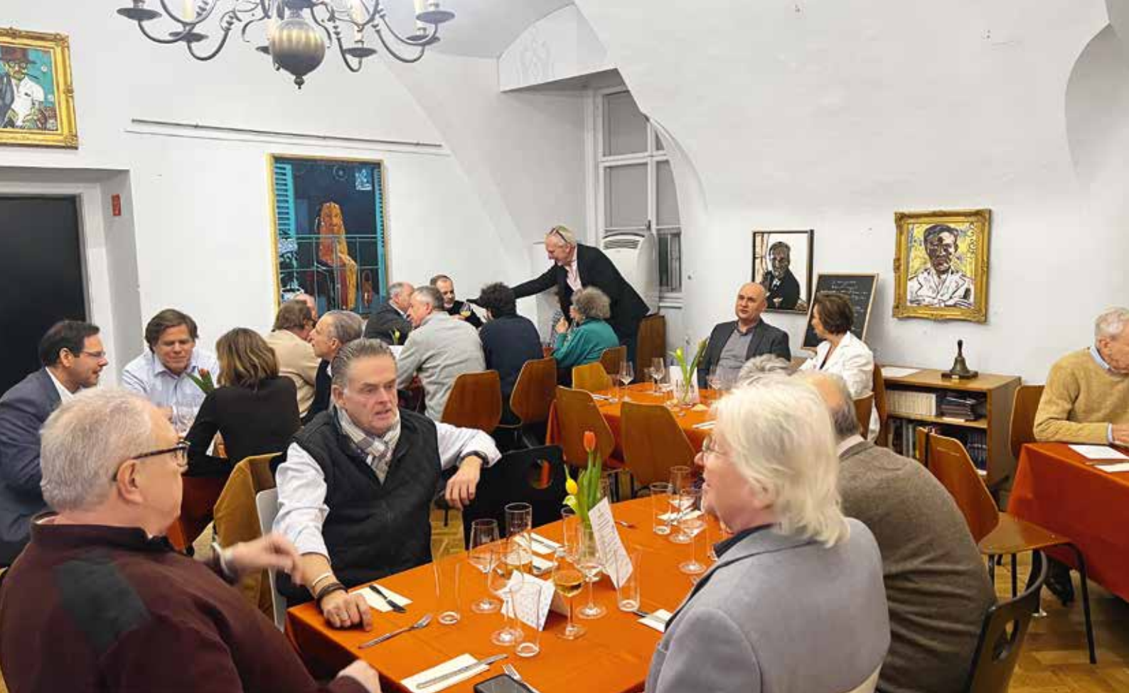
Der Heringschmaus im Club war ausgebuht!