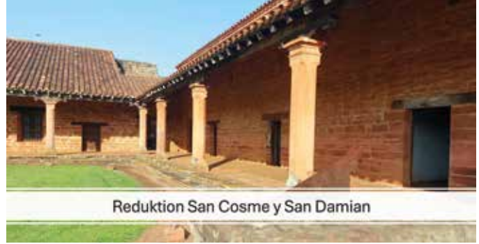
Reduktion San Cosme y San Damian