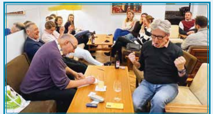
Das Gewinnerteam „Fullbright“