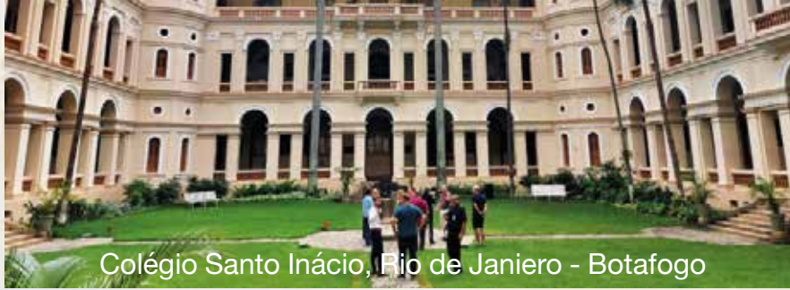
Colégio Santo Inácio, Rio de Janeiro - Botafogo