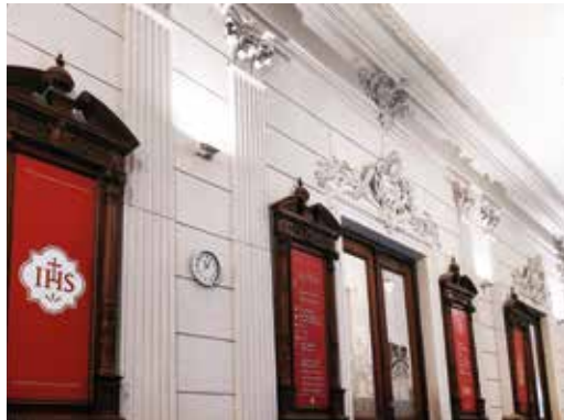
Colégio del Salvador (Buenos Aires)