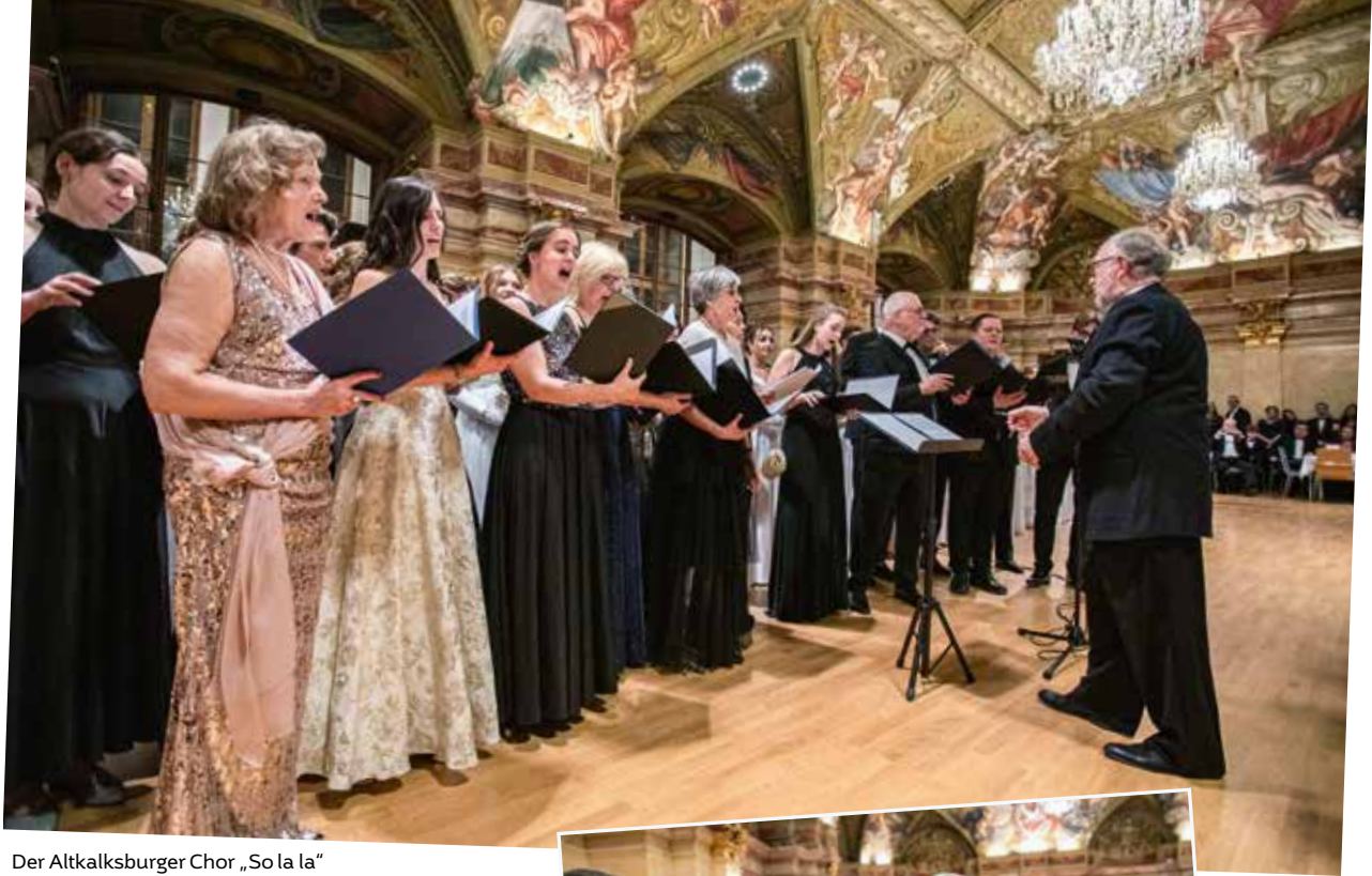
Der Altkalksburger Chor „So la la“ bei seinem Auftritt