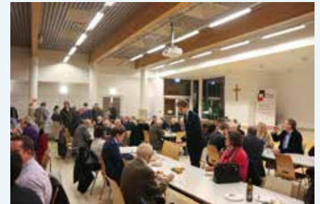
Nach der Messe gab es ein gemütliches Beisammensein im Mehrzwecksaal

Um sich auf Weihnachten vorzubereiten, gibt es viele Wege und Möglichkeiten, ein Weg des Vorbereitens, bei dem die weihnachtliche Ruhe ganz besonders zum Tragen kommt, ist unser Immaculata-Fest im Kollegium. Alljährlich am 8. Dezember markiert dieses Fest den heimlichen Beginn der ruhigsten Zeit im Jahr, ist der Erste Adventssonntag noch etwas aufgeregt, ist bis zum 8. Dezember schon Ruhe eingeleitet.