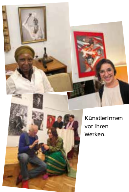
KünstlerInnen vor Ihren Werken.