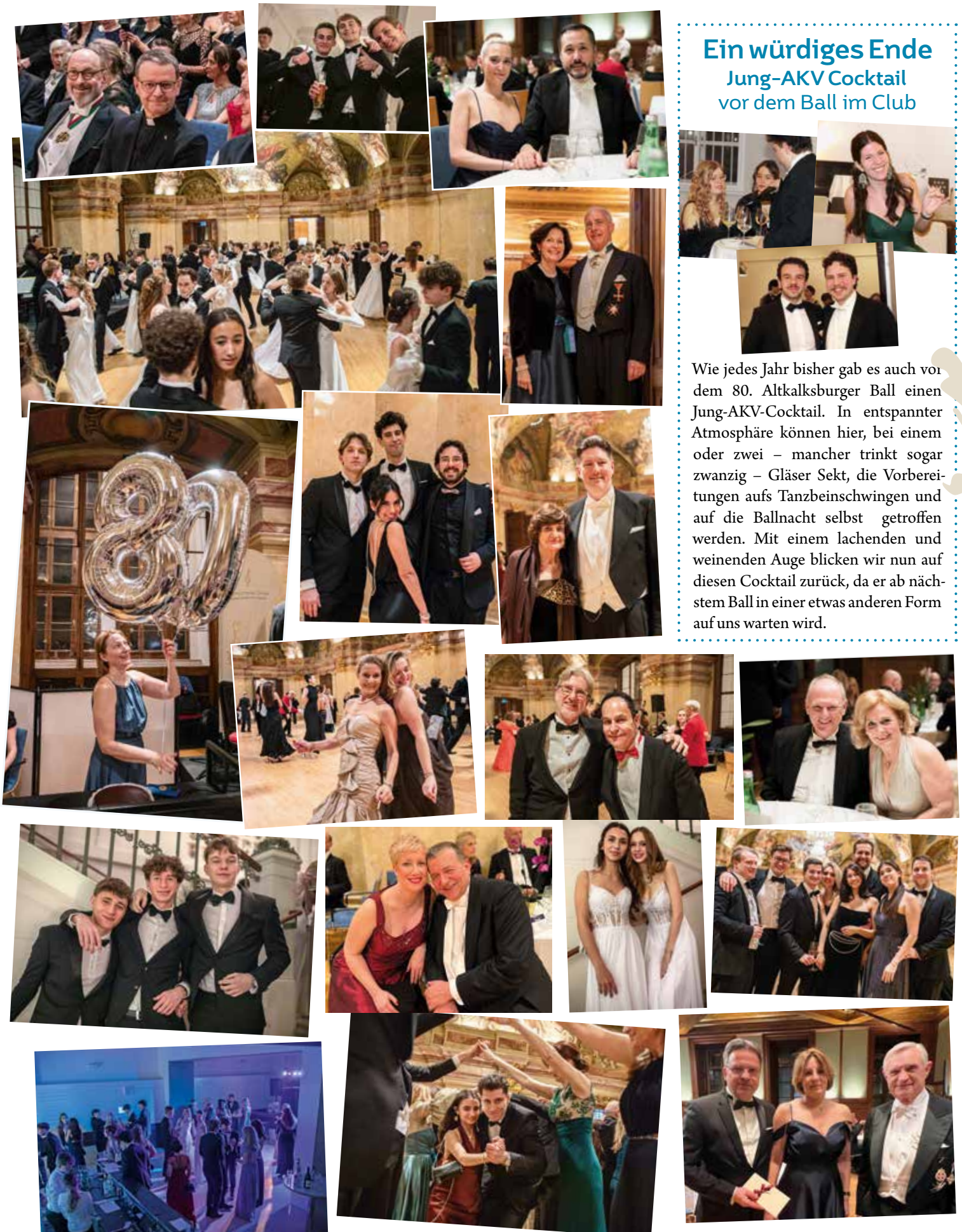
Die Ball-Disco war gut besucht

Wie jedes Jahr bisher gab es auch vor dem 80. Altkalksburger Ball einen Jung-AKV-Cocktail. In entspannter Atmosphäre können hier, bei einem oder zwei – mancher trinkt sogar zwanzig – Gläser Sekt, die Vorbereitungen aufs Tanzbeinschwingen und auf die Ballnacht selbst getroffen werden. Mit einem lachenden und weinenden Auge blicken wir nun auf diesen Cocktail zurück, da er ab nächstem Ball in einer etwas anderen Form auf uns warten wird.