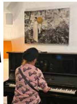
Eine musikalische Gesangs- und Klaviereinlage sorgte zusätzlich für Stimmung