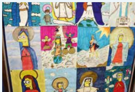
Und wieder malten SchülerInnen des KK ihre Versionen der Immaculata