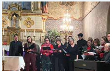
Unser AKV-Chor „So la la“ untermalte die Festmesse gesanglich