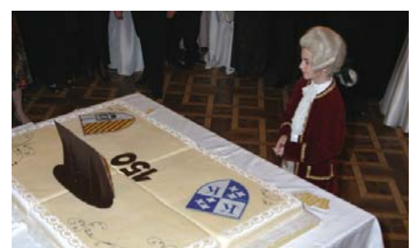
Das Geburtstagskind beim Anschneiden der Jubiläumstorte