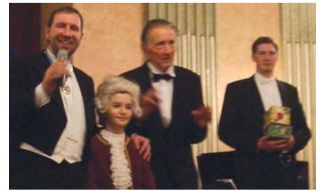
Der jüngste und der älteste Ballbesucher.