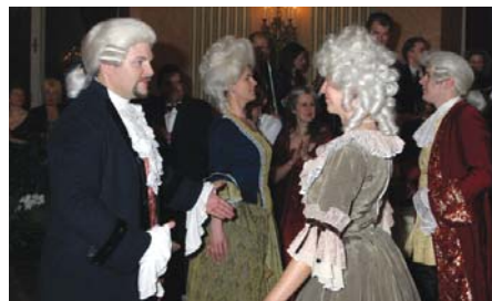
Mozarts Es-Dur Menuett als Mitternachtseinlage