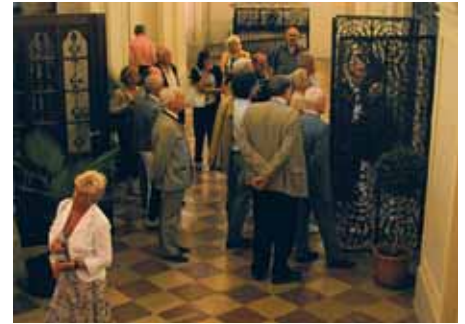
Vom Staunen erfasst: Die Gruppe der Altkalksburger vor dem Verduner Altar. Der Meister gibt in der Art einer Biblia Pauperum Einblick in das Alte und Neue Testament.